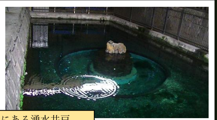
阪神御影駅すぐ西にある湧水井戸