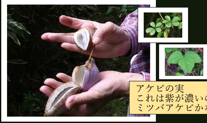
アケビの実 これは紫が濃いので ミツバアケビかな？