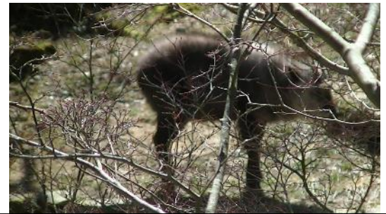
園内で飼育されているニホンカモシカは 国の特別天然記念物です 4~5 頭？