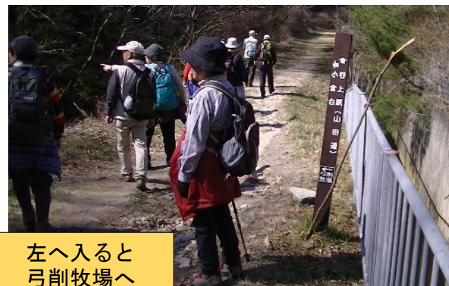
左へ入ると 弓削牧場へ