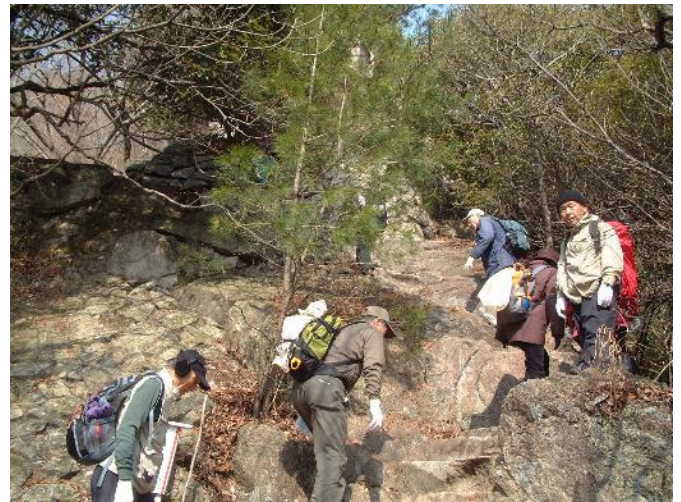
この尾根道は一般ルート。多くのクライミング練習岸壁はこのルートからは見えない