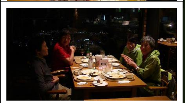
夜景を楽しみながらのディナー