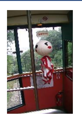
ケーブルカー内に吊るされていたテルテル坊主 「ありがとう おかげさまで晴れたわ」