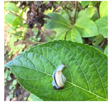
このあたりを生息地としている“クチベニマイマイ”。 移動範囲が狭いためあまり広がっていない。