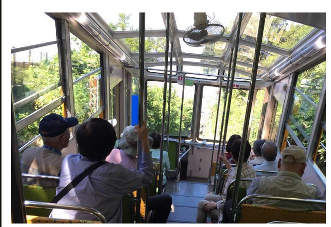
ケーブルカーで山上へ