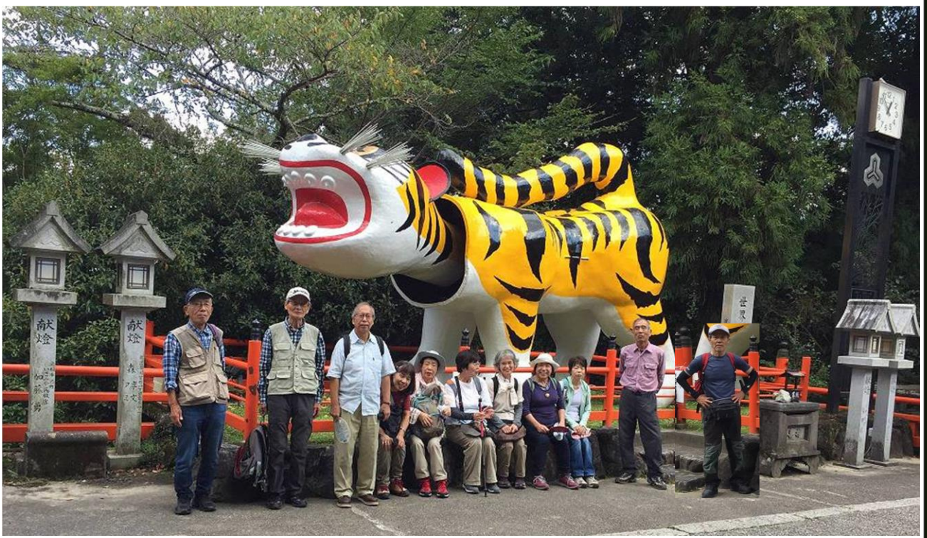
でっかいなあ パワースポットだそうなのでゆっくりして行くよ。