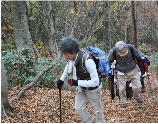
誰や平気 平気なんて言ってたんわ