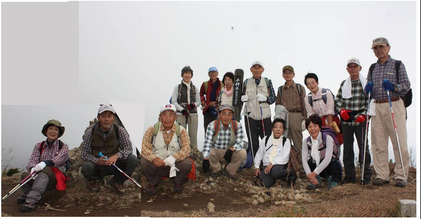
← この部分は合成 →