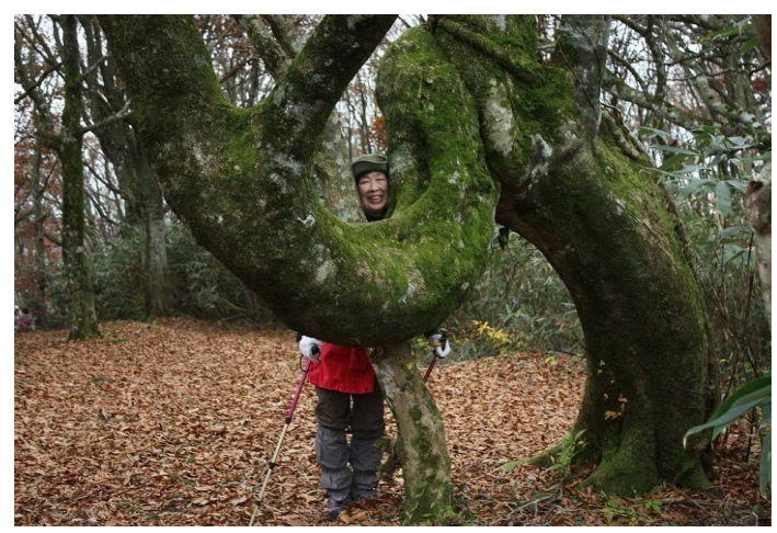
このブナの木 若いときいじめにあったのかな？