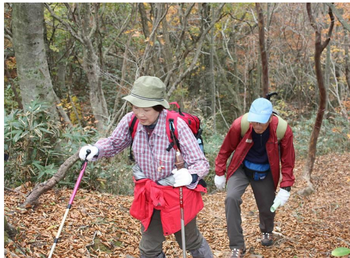
しんどい時は “しんどい～” 言うたらええんよ