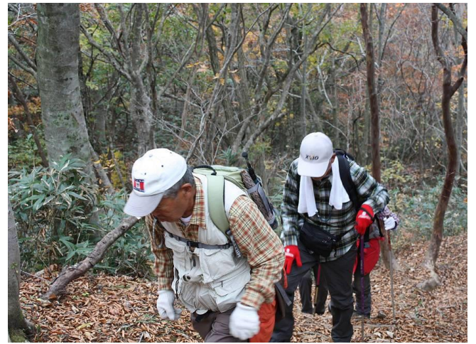
う～んψδと☆… こういう所があるから登ってしまえば気持ちがあえんよ