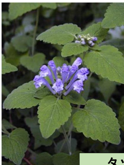
タツナミソウ (5, 6 月)