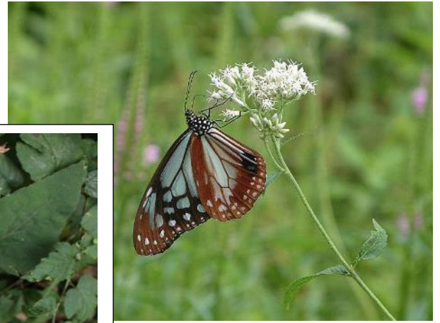
ヒヨドリバナを食草とするアサギマダラ