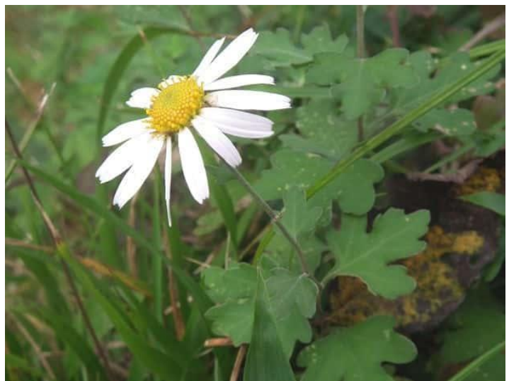
リュウノウギク (10, 11 月)