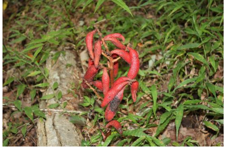
← 花(6,7月)ツチアケビ↑実(10月)