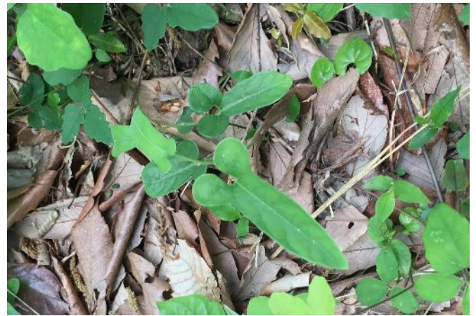
ナガバノアリマウマノスズクサ (5~6 月)