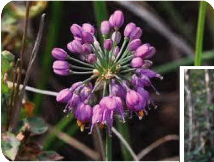
ヤマラッキョウ(10, 11月)