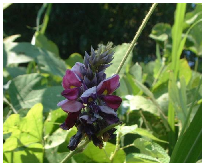
クズ (7~9 月)