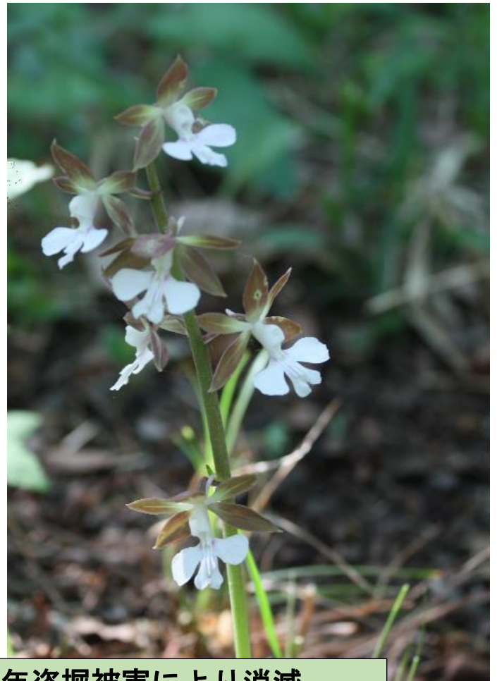
エビネ(4~5月) : 2019年盗掘被害により消滅