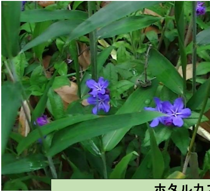
ホタルカズラ (4~5 月)