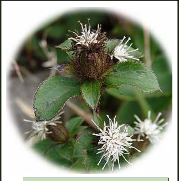
オケラ (9, 10 月)