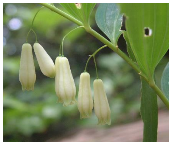
ナルコユリ (5, 6 月)