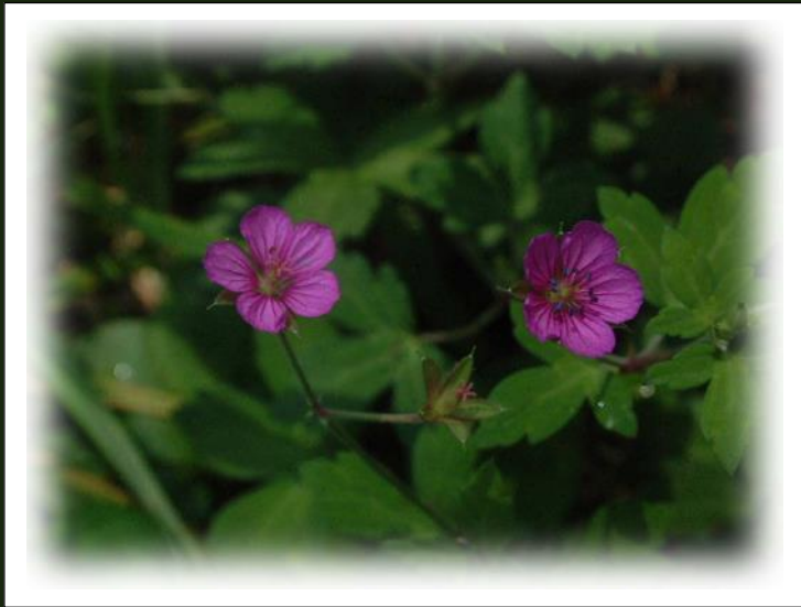
ゲンノショウコ (7~10 月)