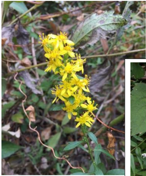
アキノキリンソウ (9~11月)