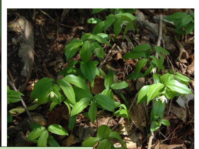
チゴユリ (4, 5 月)