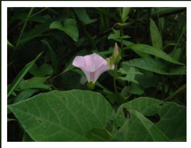
ヒルガオ (6~9 月)