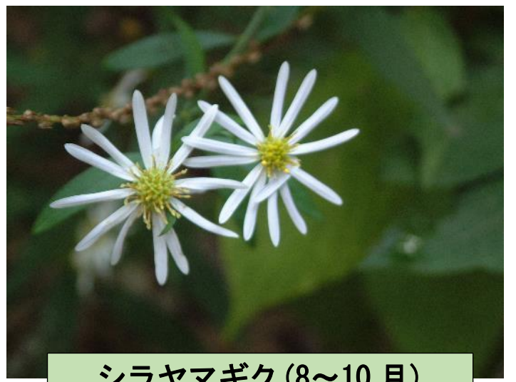
シラヤマギク (8~10 月)