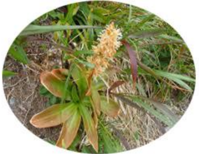
ノギラン (8~10 月)