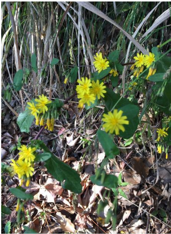
ヤクシソウ (9~11 月)