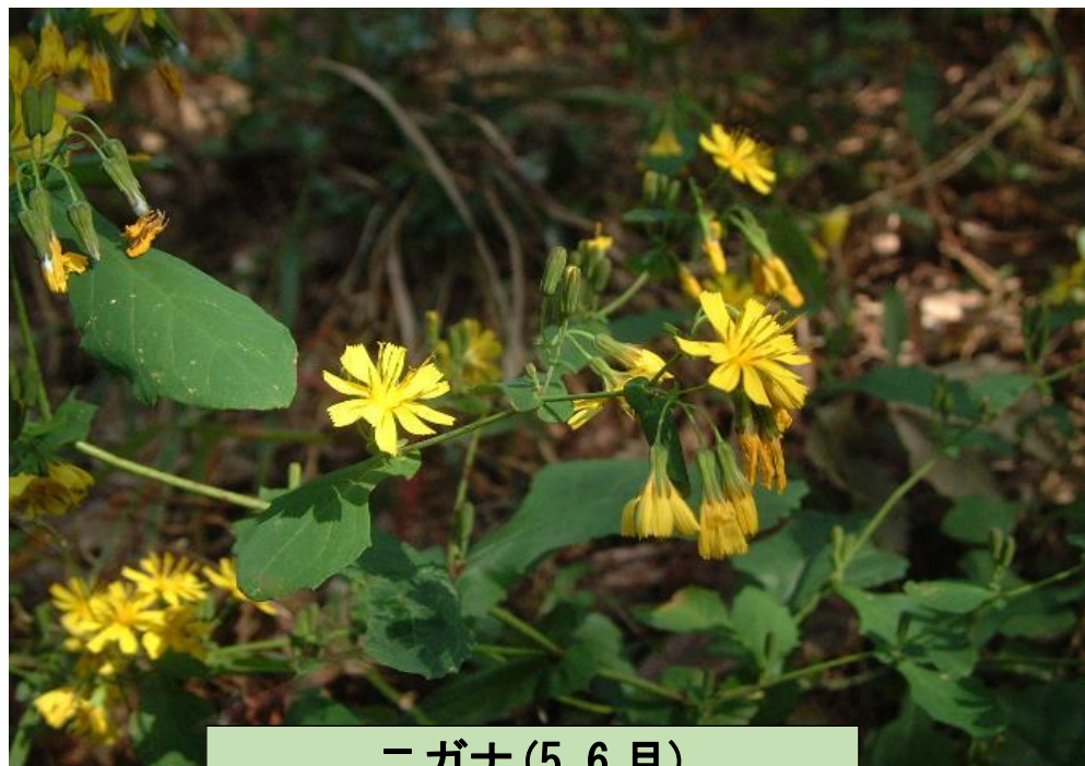
ニガナ (5, 6 月)