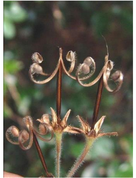
ゲンノショウコ 種はじきの後