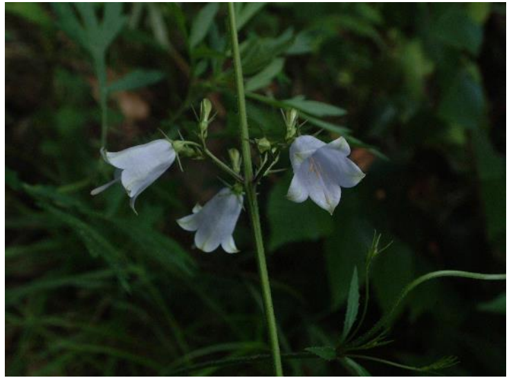
ツリガネニンジン (8~10月)