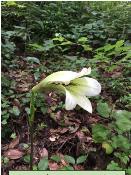
ウバユリ (8 月)