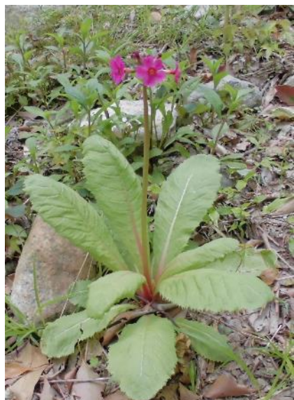
クリンソウ (5~6 月)