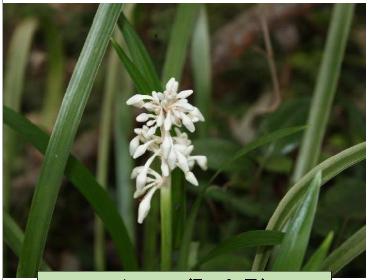
ノシラン (7~9 月)