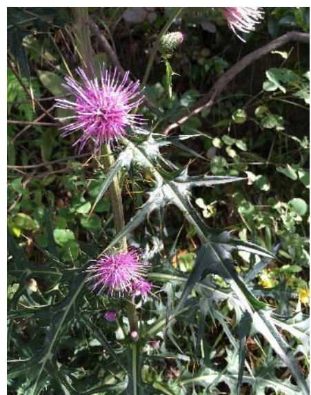
ノアザミ (5~7 月)