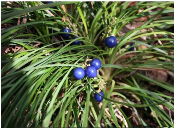
ナガバジャノヒゲ (10 月)