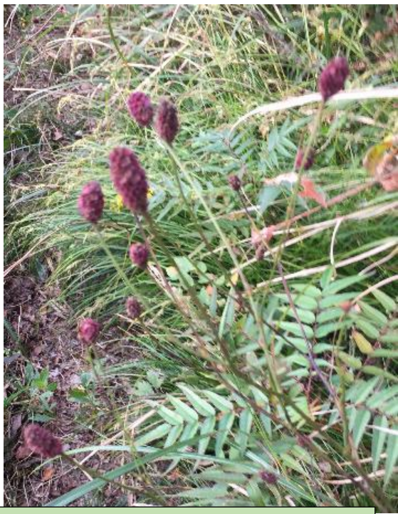
ワレモコウ (9~11 月)