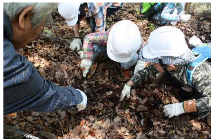
初期の生育場所での幼虫探し