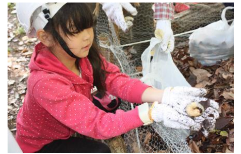
観察場所が木柵当時の生育場所での幼虫探し