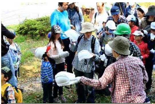
観察会はヘルメット着用だよ～