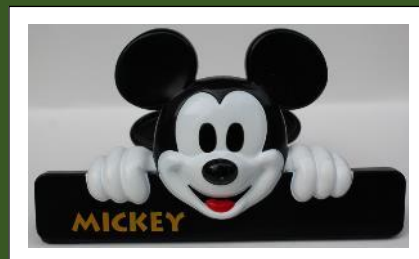
ゆるゆるミッキーづくり