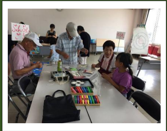
ぶんぶんごまづくりのコーナー