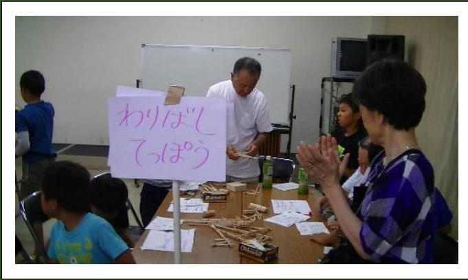
割りばしてっぽうづくりのコーナーも毎年人気を集めている。