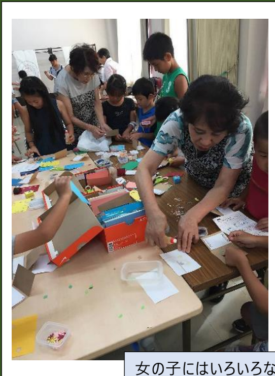
女の子にはいろいろな小物飾りが人気。「抜き型絵」「メッセージカードづくり」「きんちゃく袋づくり」など、その年々趣向を凝らしたブースで参加。